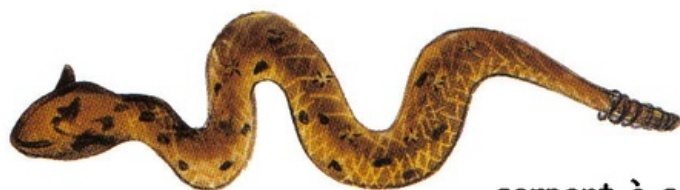
serpent à sonnette (crotale)

Les serpents sont des reptiles . Ce sont des animaux à sang froid , c'est-à-dire que la température de leur corps dépend de la température extérieure. Par conséquent, on trouve surtout des serpents dans les régions chaudes.