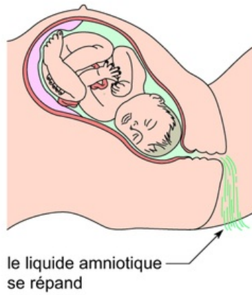
dilatation du col utérin