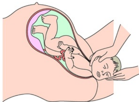
expulsion de l'enfant