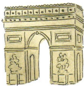
Arc de triomphe