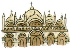
Saint-Pierre de Rome