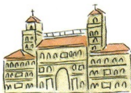
palais des Médicis

La richesse du patrimoine architectural français et italien peut être évoquée à travers quelques monuments . En France, on peut citer par exemple l' Arc de Triomphe (Paris, 1836) qui fut construit sur l'ordre de Napoléon, l' Opéra (Paris, 1875), le Panthéon (Paris, 1780) ou le château de Chambord (rive de la Loire, XVI e siècle).