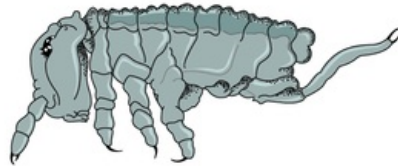
Collembole taille réelle : 5 mm

Tous les êtres vivants (champignons, bactéries et animaux), souvent microscopiques ou de petites tailles, ont une importance capitale dans la formation du sol. Ils permettent la décomposition biologique du sol.