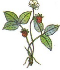
fraise des bois