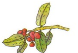
chèvrefeuille des bois