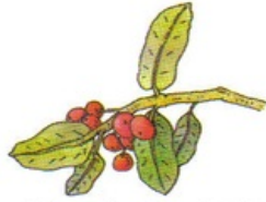
chèvrefeuille des bois