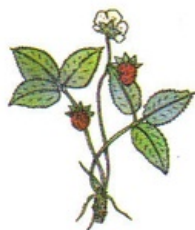
fraise des bois