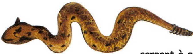
serpent à sonnette (crotale)

Les serpents sont des reptiles . Ce sont des animaux à sang froid , c'est-à-dire que la température de leur corps dépend de la température extérieure. Par conséquent, on trouve surtout des serpents dans les régions chaudes.