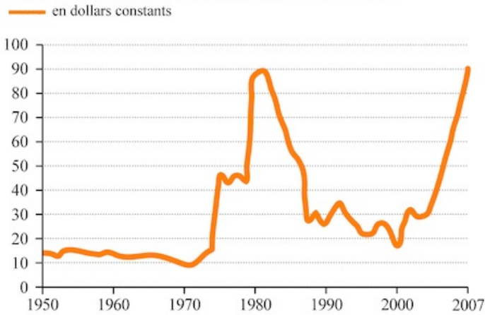
COURS DU BARIL DE PÉTROLE DEPUIS 1950