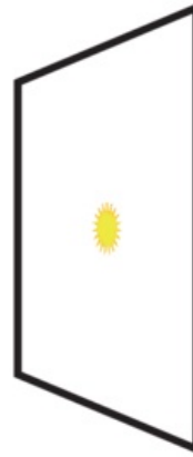
Un point lumineux est observé sur l'écran, au foyer de la lentille

• Pour trouver expérimentalement le foyer d'une lentille convergente, il suffit d'orienter la lentille vers le Soleil et de rechercher la position de l'écran qui permet d'observer un point très lumineux. Ce point est l'image du Soleil, c'est aussi le foyer de la lentille. La distance entre la lentille et l'écran est égale à la distance focale de la lentille.