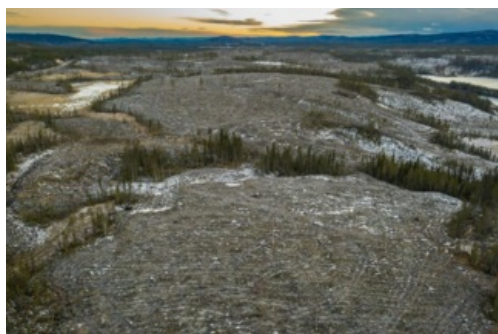
Une forêt privée coupée à blanc près de la ville de Jokkmokk (Suède), en novembre 2020. La richesse en lichen de cette forêt était importante pour les populations de rennes.

Le royaume scandinave pratique une sylviculture basée sur la monoculture et les coupes rases. Mais les critiques montent devant les dégâts pour le climat et la biodiversité.