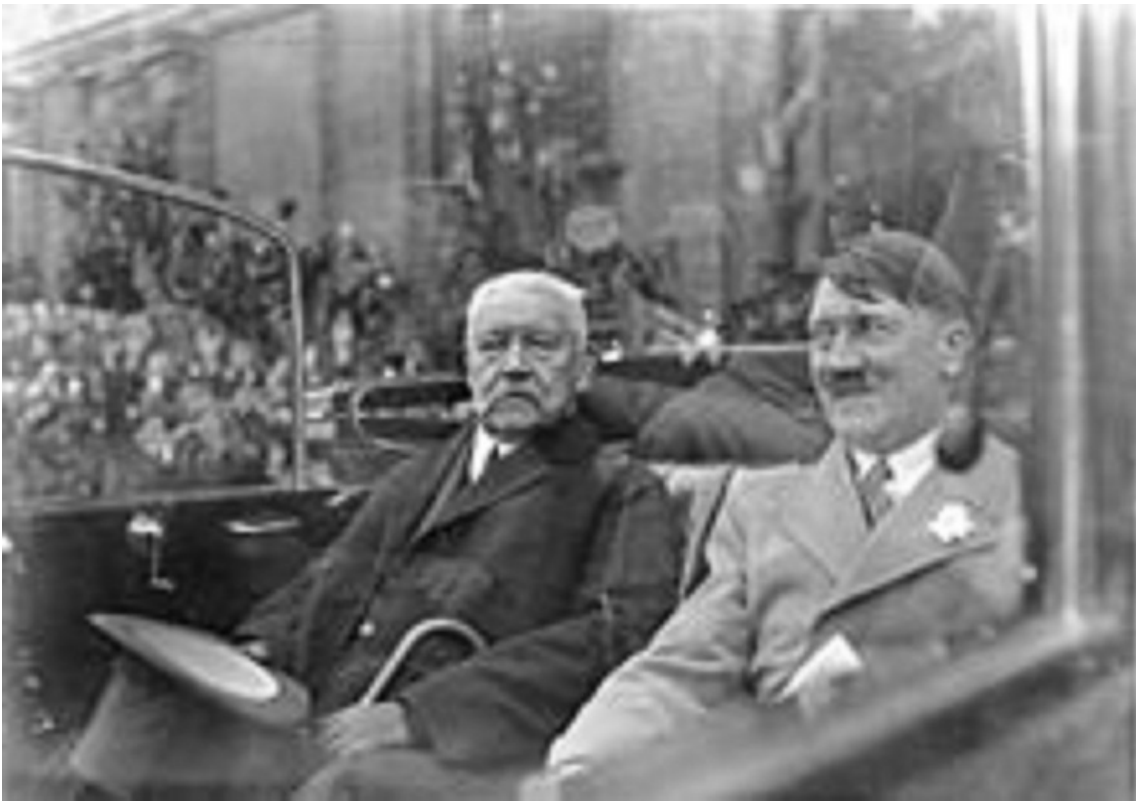
5. L'arrivée d'Hitler au pouvoir