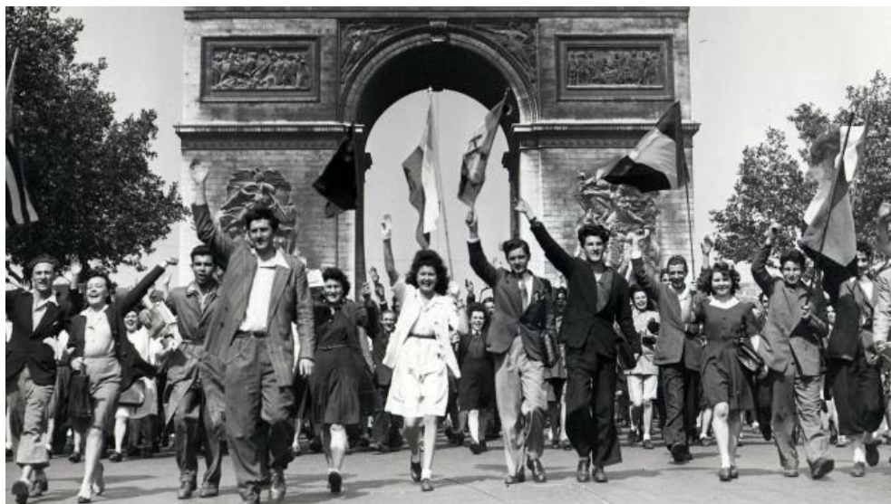
2. La libération de la France