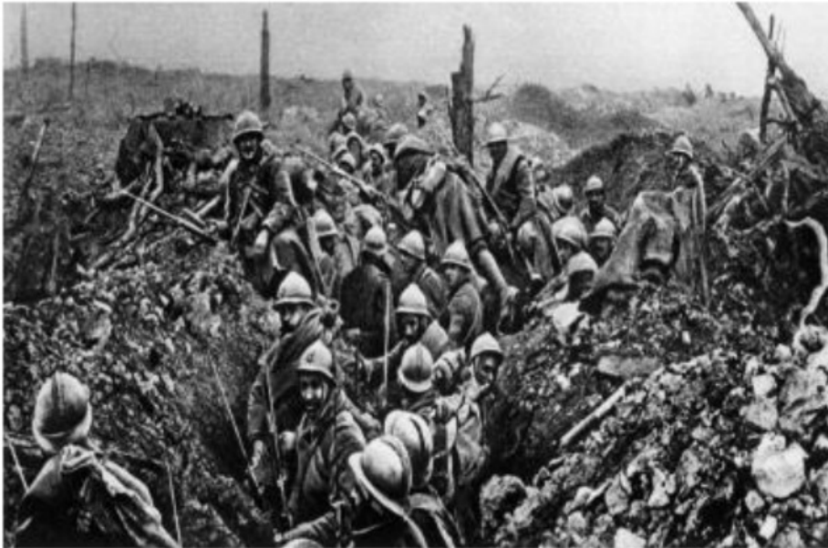
4. La Première Guerre mondiale