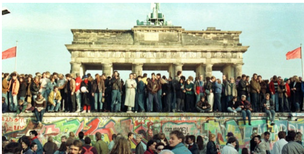
1. La chute du mur de Berlin

Situez les événements sur la frise chronologique ci-après, en reportant le numéro correspondant dans la case.