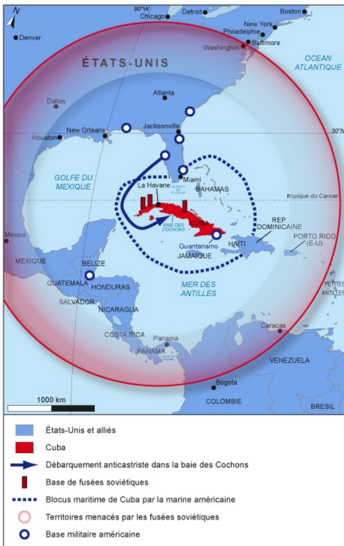
La crise des fusées de Cuba, 1961-1962

• La crise des fusées à Cuba (1962) constitue sans doute le point culminant de l'affrontement entre les deux blocs. En 1959, Fidel Castro prend le pouvoir à Cuba. Les États-Unis soutiennent un débarquement d'exilés cubains qui échoue (baie des Cochons, avril 1961). Castro demande alors la protection des Soviétiques, qui tentent d'installer des missiles nucléaires sur l'île. Le président américain John F. Kennedy ordonne le blocus de Cuba : les cargos soviétiques font demi-tour. Des négociations permettent d'éviter une confrontation directe entre les deux grands. Jamais la tension n'avait été aussi forte.