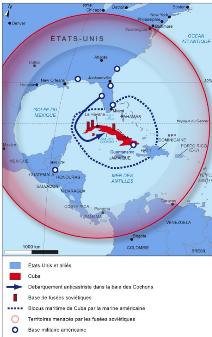
La crise des fusées de Cuba, 1961-1962

• La crise des fusées à Cuba (1962) constitue sans doute le point culminant de l'affrontement entre les deux blocs. En 1959, Fidel Castro prend le pouvoir à Cuba. Les États-Unis soutiennent un débarquement d'exilés cubains qui échoue (baie des Cochons, avril 1961). Castro demande alors la protection des Soviétiques, qui tentent d'installer des missiles nucléaires sur l'île. Le président américain John F. Kennedy ordonne le blocus de Cuba : les cargos soviétiques font demi-tour. Des négociations permettent d'éviter une confrontation directe entre les deux grands. Jamais la tension n'avait été aussi forte.