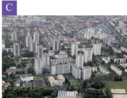
La Courneuve (commune près de Paris)

Associez chacune des photographies à un espace du schéma :