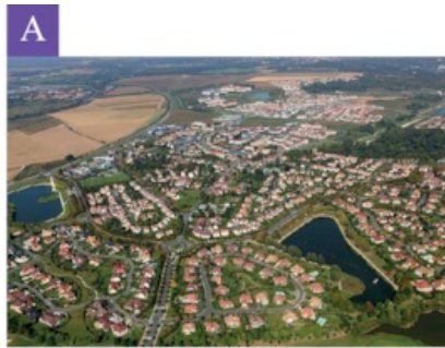
Magny-le-Hongre (commune du Bassin parisien)