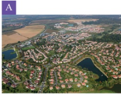
Magny-le-Hongre (commune du Bassin parisien)